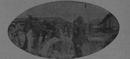
Aspecto que presentaba la esquina de "El Molino" dos días después de la terrible catástrofe. Grupo de vecinos comentando los grandes destrozos que ocasionó la inundación.

«En la mañana frente al Hospicio de Huérfanos en construcción (*) el río entró por los solares de