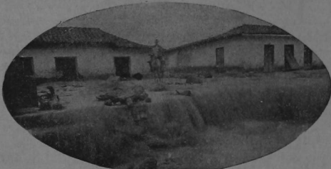
Esquino de "El Molino" algunas horas después de la primera avenida. El río conlizo la calle y formó cascadas el lado Norte del Hospicio de Huérfanos, en ese tiempo en construcción.

Un día es el río que saliendo de madre, se lanza en sinistros torbellinos por las calles de la población, despierta á los dormidos con amenazas de muerte, siembra el pánico y deja sin sus hogares y sin sus menajes á centenares de familias.