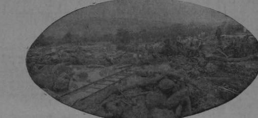
Calle del tranvía, al día siguiente de la inundación. La escena está tomada frente al mercado de ganado, en las inmediaciones de "El Molino".