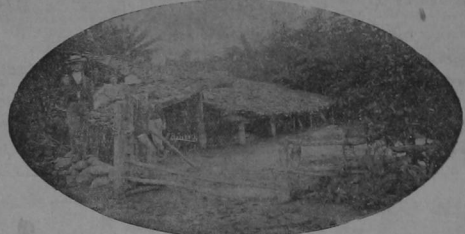
Casa de una ladrillera en el Aguacollente, donde la grande avenida del río en busca de un banco de arena de 1 metro 5 centímetros de espesor; el agua casi destruyó el edificio, ocasionando daño.

«Pocos momentos después el agua principal á salir por tres calles transversales al Este de El Molino, que es el límite de la ciudad. El pánico subió