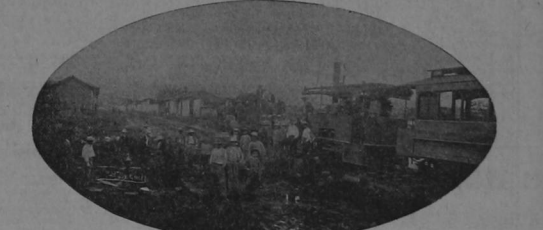
Materiales arrojados por la inundación sobre el puente del río "Reventado" en la vía férrea y sobre los potreros circunvecinos, lugar donde fué destruido un gran trecho de línea férrea.

«Por cinco días consecutivos no se le había vuelto á ver la cara al Sol; el cielo estaba de plomo y el horizonte oscuro como conciencia de criminal. Las gentes vecinas al Reventado pasaron la noche en vela, viendo crecer y crecer aquel río enfurecido; á las 5 a. m. del 27, emprendieron la fuga, pues el enemigo había inundado multitud de casas.