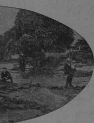
La primera planta eléctrica de Cartago destuida por la inundación.—Vista tomada cuando bajaron las aguas.— Como se ve en la fotografía, el edificio quedó totalmente destruido.

Otro día es el río que saliendo de madre, se lanza en sinistros torbellinos por las calles de la población, despierta á los dormidos con amenazas de muerte, siembra el pánico y deja sin sus hogares y sin sus menajes á centenares de familias.